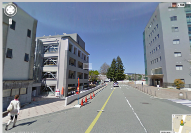
CUI = Google View

CUI では「今何処にいるか」が重要。 見たいもの（ファイル等）があったらそこまで移動しないとイケない。