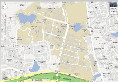
GUI = Google Map

GUI は Google Map で、CUI は Google View である！